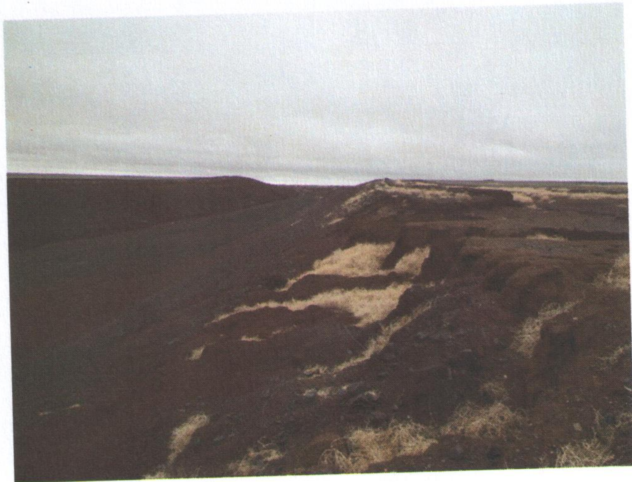
Зураг 1. Үргэлжлэл