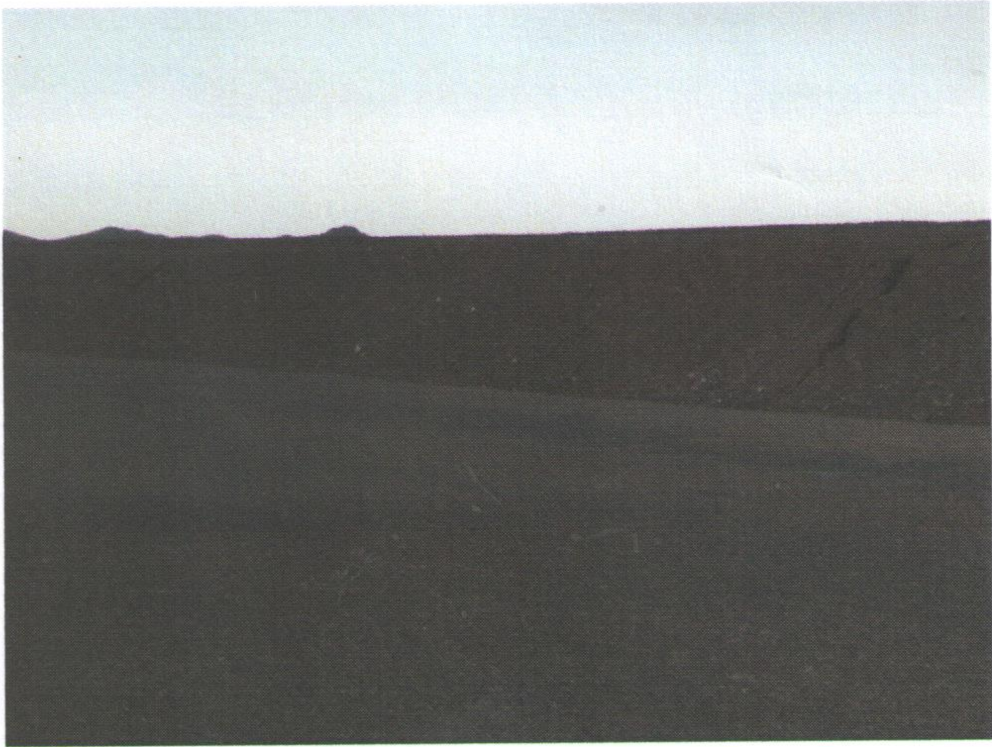
Зураг 4. 105-106 км дэх эвдрэл