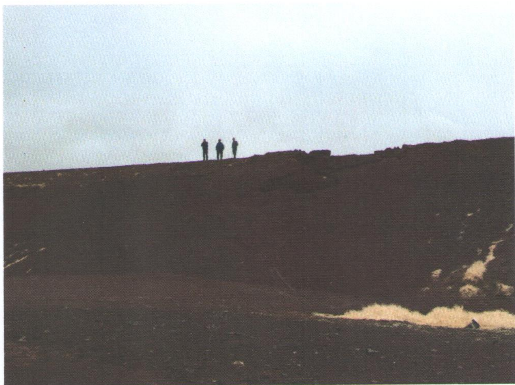
Зураг 2. Хучилтын үеэр ус гүйсэн байдал