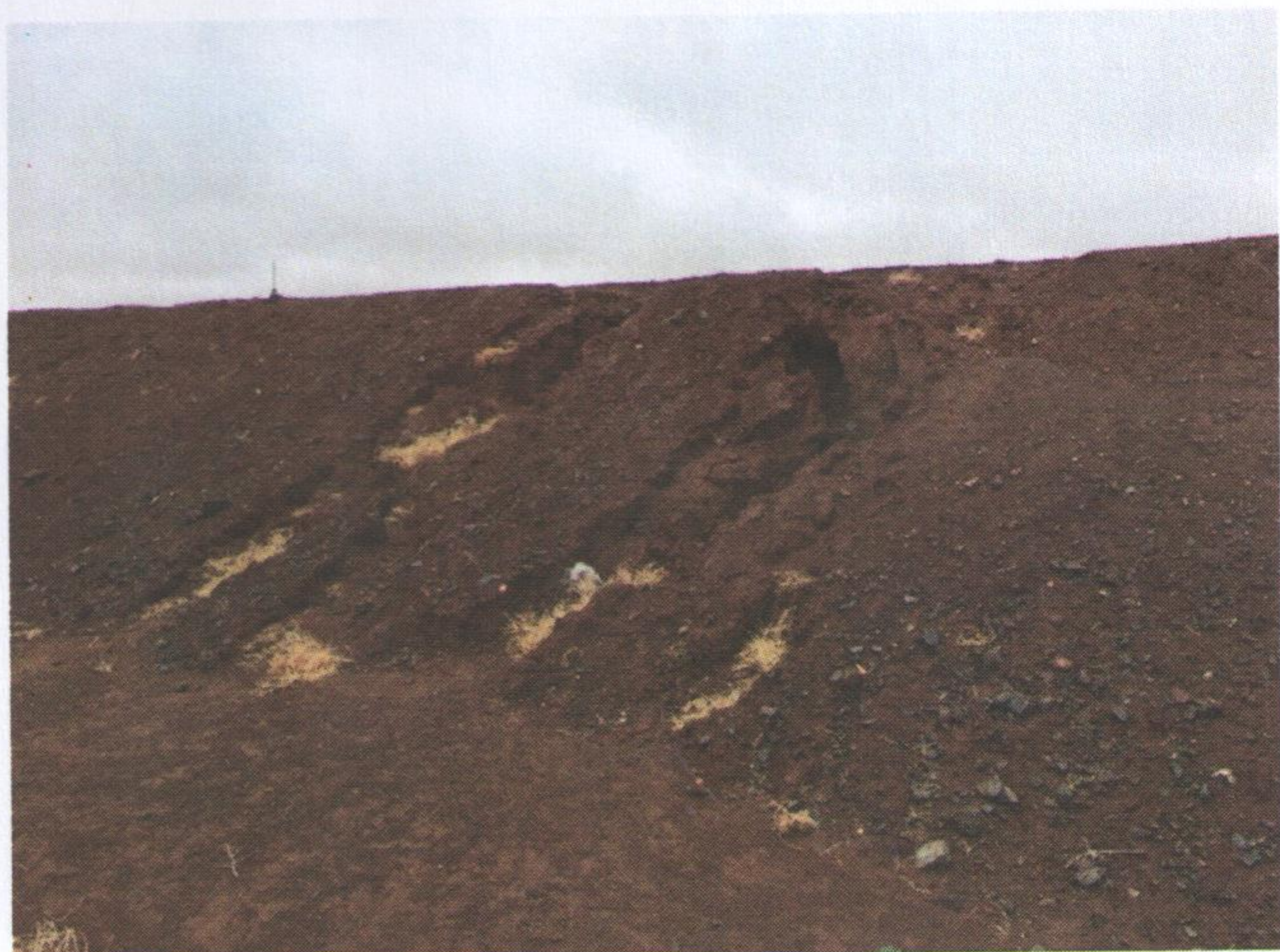
Зураг 1. 17-19 км дэх эвдрэл