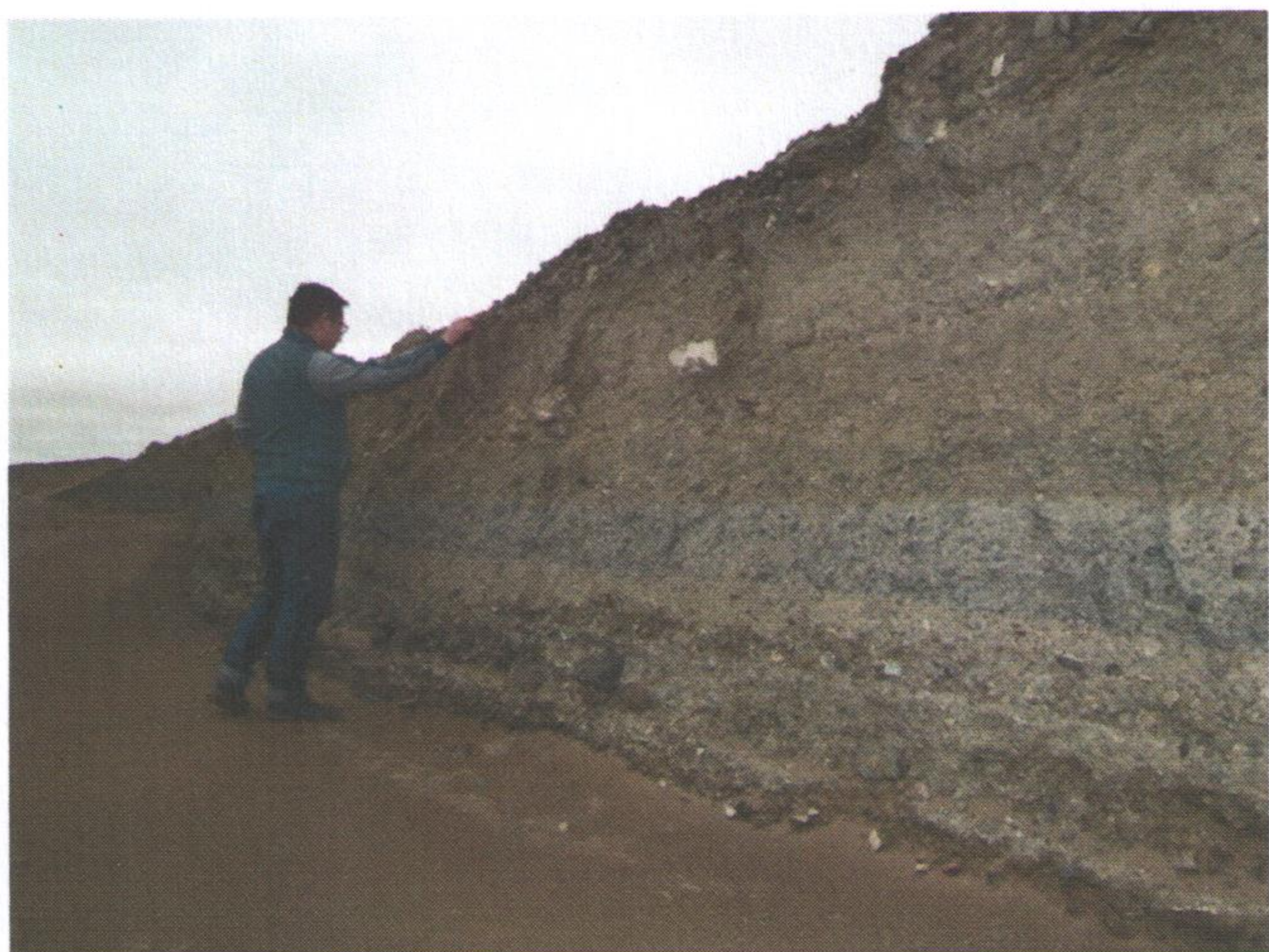
Зураг 3. 41-р км 34 м дэх далангийн эвдрэл